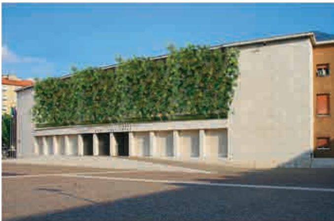
Projekt von Riegler Veranstaltungstechnik für einen zeitgemäßen Umgang mit dem faschistischen Mussolini-Relief an der Casa Littoria in Bozen