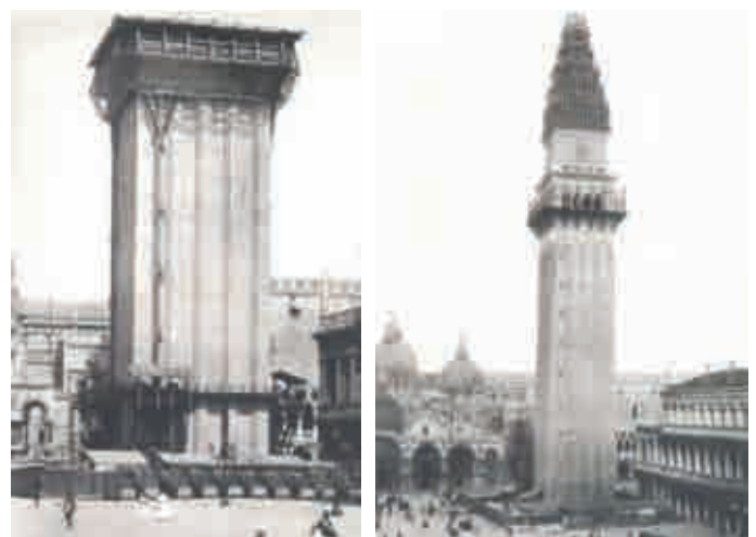
Venedig, Piazza San Marco Wiederaufbau des Campanile 1903-1912, „com'era e dov'era“ (so wie er war und wo er war)