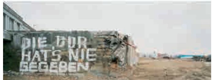
Berlin, Abriss des Palastes der Republik, von Feb. 2006 bis Dez. 2008 Bilder von Arwed Messmer „Anonyme Mitte Berlin“