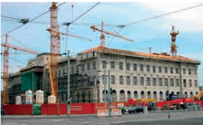
Braunschweig während der Rekonstruktion