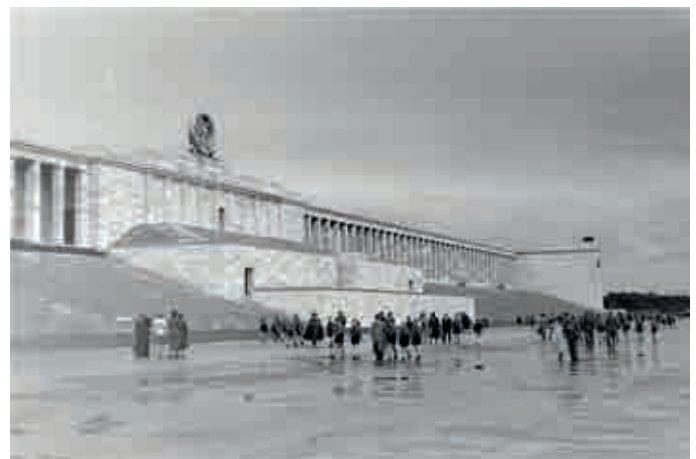
Reichsparteitagsgelände Nürnberg, Zeppelintribüne ohne Veranstaltung, Foto von 1938