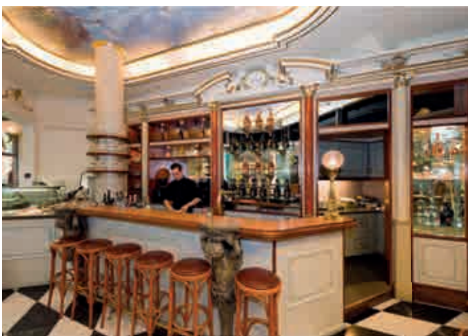
Schauwer; Neumarkt in Dresden. Neues „QF-Hotel“, 2006, „barocke“ Hotelbar.