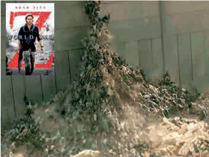
Filmstill aus dem Film „World War Z“ (Regie: Marc Forster 2013)