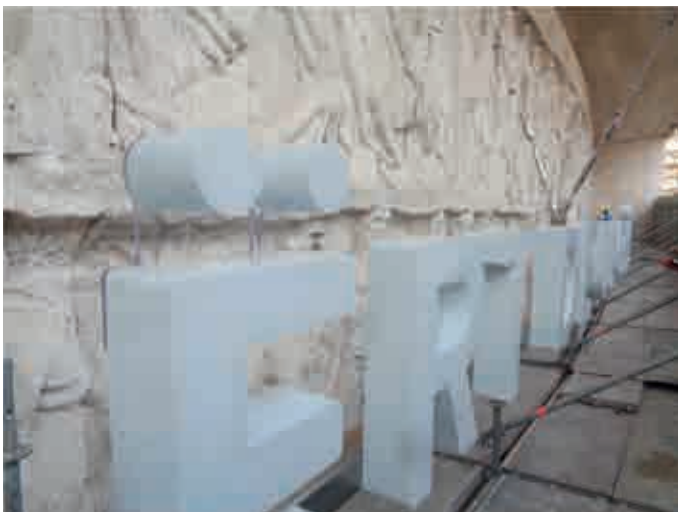
„Kein Mensch hat das Recht zu gehorchen“ (Hanna Arendt); Detailaufnahme der montierten Schrift vor dem Mussolini-Relief