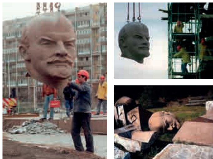
Links & Oben: Demontage des Lenindenkmals am 13.11.1991, nachdem die zerlegte Statue in einer Sandgrube im Berliner Stadtforst Köpenick vergraben worden war, wurde sie wieder an die Oberfläche gehievt (rechts unten). Der Kopf soll 2014 im zusammen mit anderen „nicht mehr gebrauchten“ Berliner Denkmälern in der Zitadelle Spandau gezeigt werden.