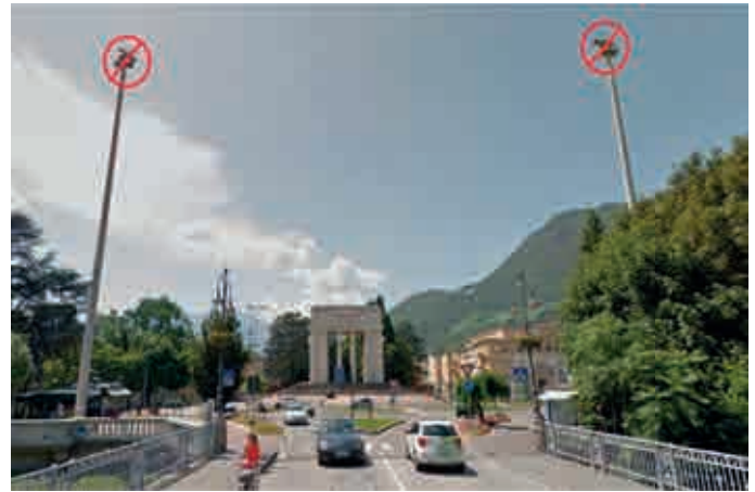
Pamphlet gegen die Wiederanbringung der faschistischen Symbole auf den Stangen vor dem Siegistor.