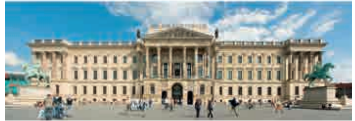
Rekonstruiertes Schloss Braunschweig bzw. Kulturinstitut und Einkaufszentrum „Schlossarkaden“, 2005-2007