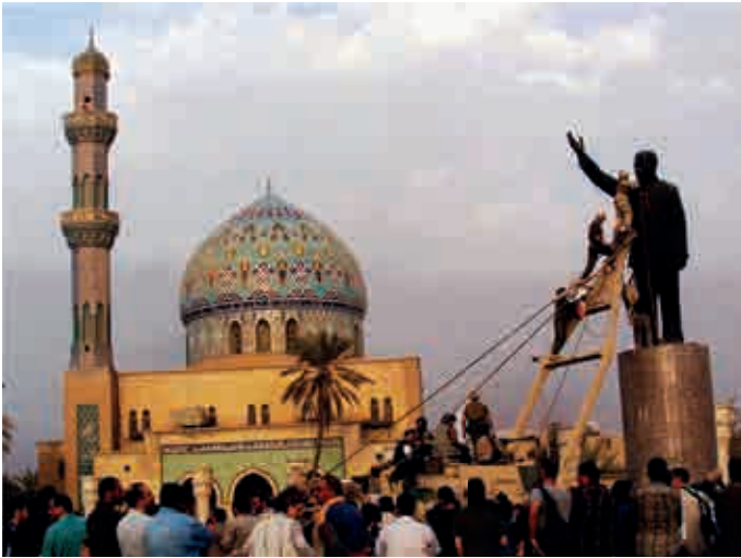
Bagdad, 9. April 2003, ein Standbild von Saddam Hussein am Firdaw-Platz wird gestürzt