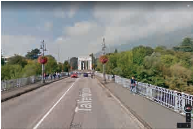
Siegestor in Bozen; davor links und rechts zwei hohe Stangen, wo wieder die faschistischen Symbole der römischen Wölfin und des Löwen montiert werden sollen.