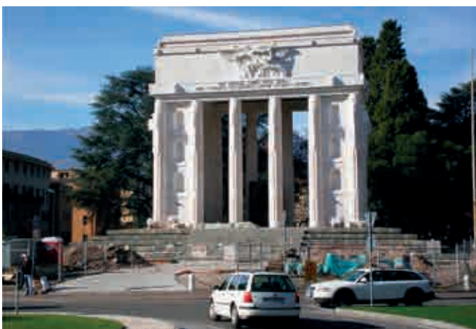
Faschistisches Siegesdenkmal in Bozen, Marcello Piacentini 1926-1928