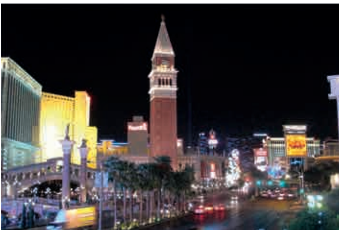
The Venetian Hotel and Casino Resort in Las Vegas, Nachtaufnahme