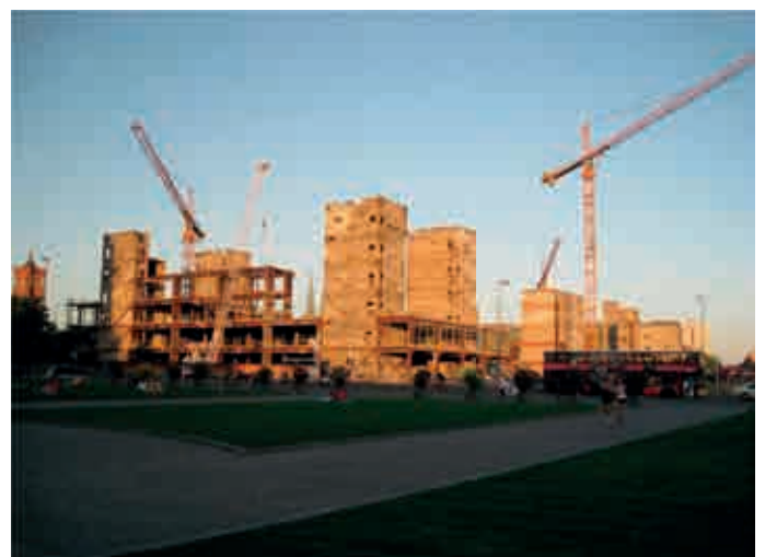
Berlin, Abriss des Palastes der Republik, von Feb. 2006 bis Dez. 2008