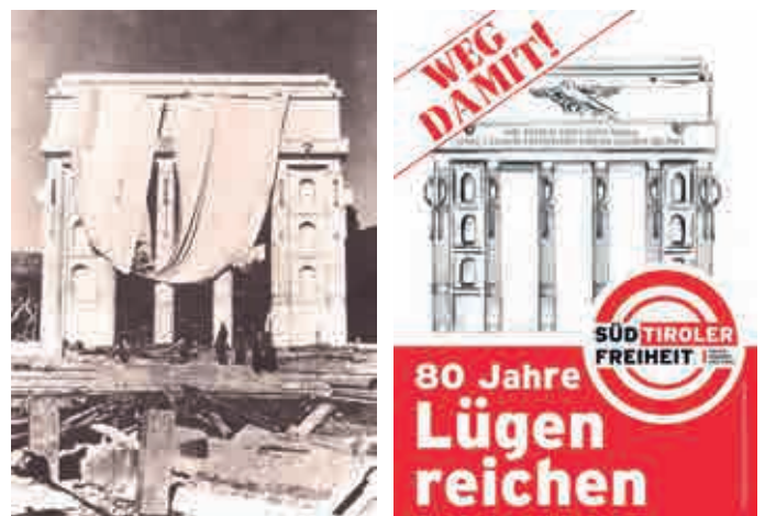
Links: Faschistisches Siegesdenkmal in Bozen, kurz vor der Fertigstellung. Rechts: zeitgenössisches Flugblatt, das den Abbruch des Siegesdenkmals verlangt