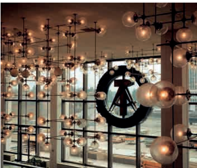
Berlin, Palast der Republik, Inneres („Erichs Lampenladen“)