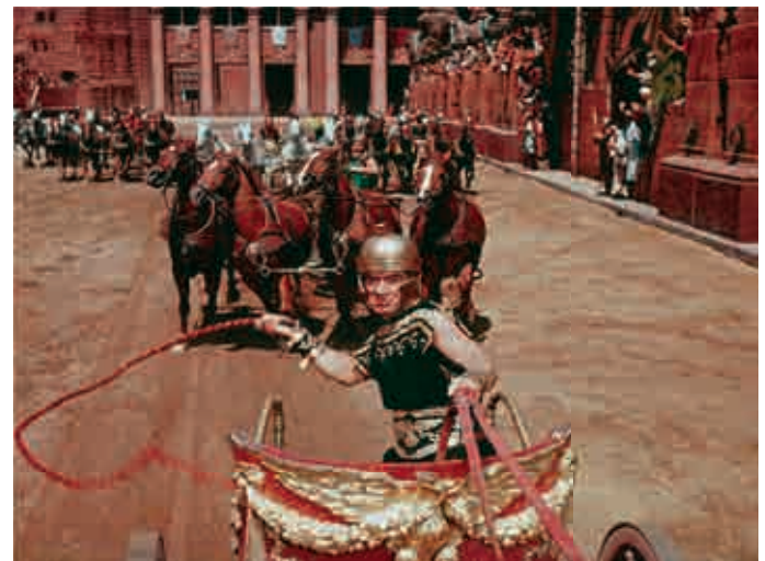
„Schauwert“: Standfoto aus dem Monumentalfilm Ben Hur, USA 1959. Der Schauwert von Massenszenen drängt zuweilen die Handlung in den Hintergrund