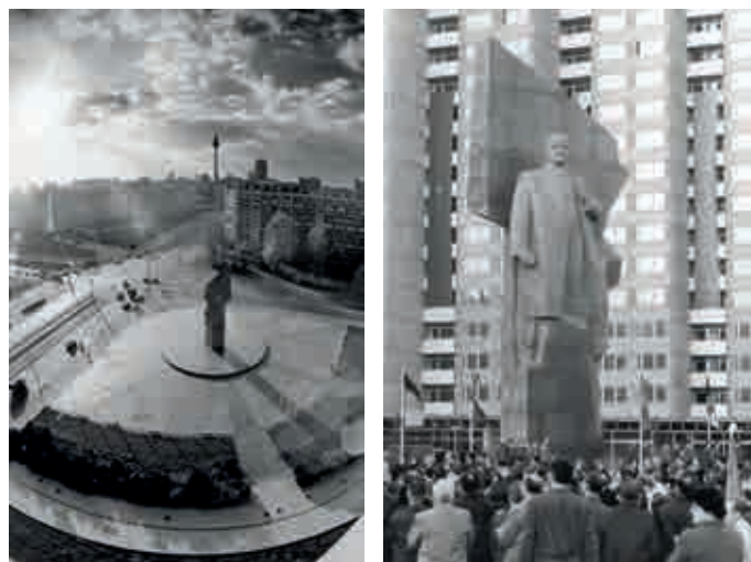
Rechts: Berlin, Leninplatz mit Lenindenkmal von Nikolai Tomski, anlässlich der Einweihung am 19.4.1970 Links: Gesamtansicht mit Platzgestaltung (Foto 1988)