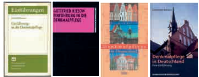
Verschiedene Ausgaben des Buchs von Gottfried Kiesow, in dem die Kriterien für die Bewertung unterschiedlicher Denkmalwerte nachzulesen sind. Achtung: Titel hat sich geändert!

Nachzulesen bei: KIESOW, GOTTFRIED, Einführung in die Denkmalpflege Darmstadt 1982, Neue Auflage unter neuem Titel: Denkmalpflege in Deutschland, Eine Einführung , 4. Auflage. Darmstadt 2000