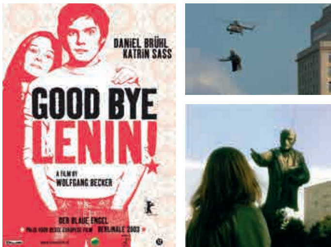
Good Bye Lenin, Filmplakat und Filmstills mit der Szene der Entsorgung einer Leninstatue in Berlin