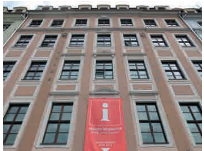
Schauwert; Neumarkt in Dresden. Neues „barockes“ Gebäude „QF-Passage“, von Stellwerk Architekten, 2006, Fassade.