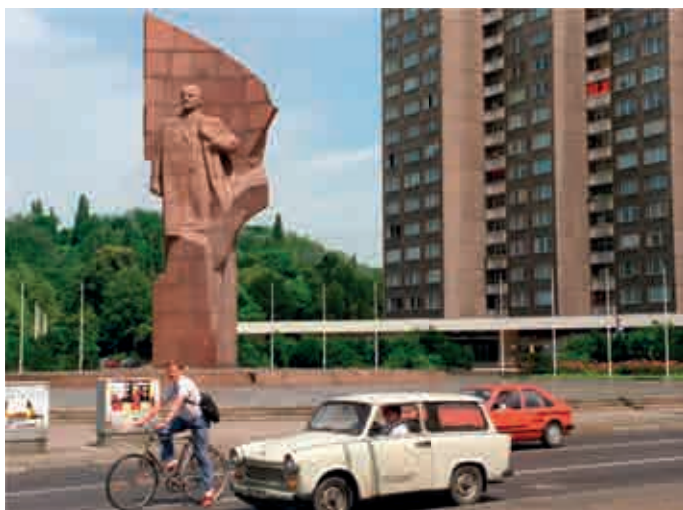
Berlin, Leninplatz mit Lenindenkmal von Nikolai Tomski, Foto aus der DDR-Zeit