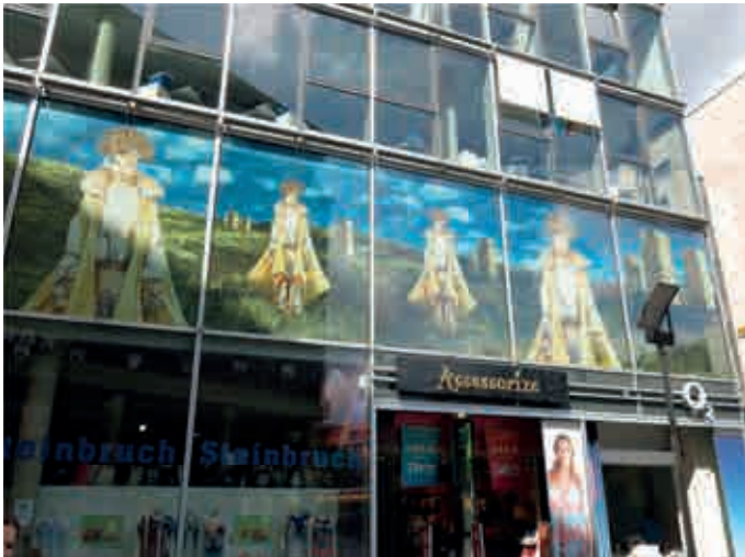
Faszination Ruine Ein desigal Geschäft in der Dresdener Pragerstraße wirbt mit den beim Abriss stehen gebliebenen Stiegenhauskernen des Palastes der Republik in Berlin.