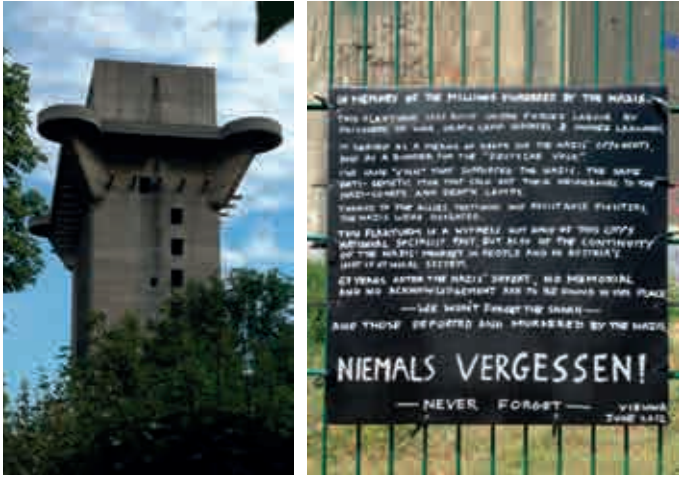
„Streitwert“ (Unbequeme Denkmale): Flakturm im Wiener Augarten (Leitturm), Juli 1944 bis Januar 1945 errichtet Rechts: von einer Privatperson am Zaun des zweiten Flakturms (Gefechtsurm) angebrachte Erinnerungstafel