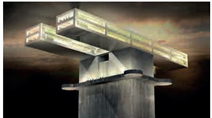
Umnutzung eines Flakturms in ein Technologiezentrum. Vorschlag von Arkan Zeytinoglu Architekten, 2001