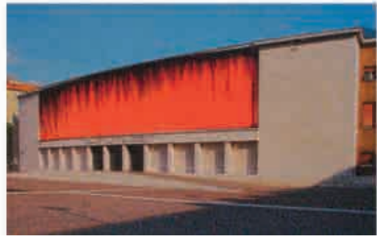
Projekt von Julia Bornefeld für einen zeitgemäßen Umgang mit dem faschistischen Mussolini-Relief an der Casa Littoria in Bozen