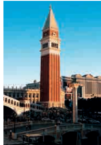
The Venetian Hotel and Casino Resort in Las Vegas, 1996-1999, mit Rialto-Brücke, Markussäule und Campanile