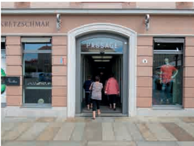
Schauwert; Neumarkt in Dresden. Eingang zur „QF-Passage“.