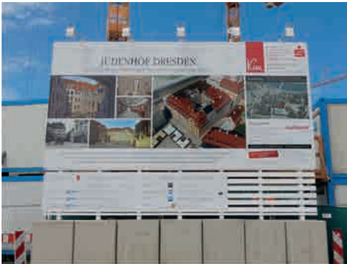
Schauwer; Neumarkt in Dresden. Bauplatk mit Projekt „Judenhof Dresden“ 2016, „hier entsteht ein barocker Baukomplex mit besonderem Innenhofkonzept und dem Flair einer italienischen Piazzetta...“