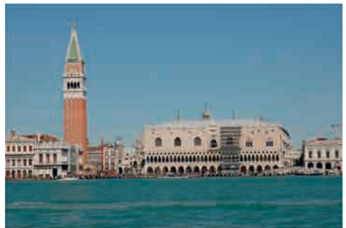
Venedig vom Bacino di San Marco aus gesehen, mit Libreria, Campanile und Dogenpalast