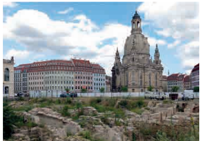
Schauwert; Neumarkt in Dresden. Rechts im Bild die rekonstruierte Frauenkirche, linke Bildhälfte im Hintergrund neu erstelle Gebäude im „barocken“ Gewand. Im Vordergrund die originalen Reste der Keller der im Zweiten Weltkrieg zerstörten Häuser.