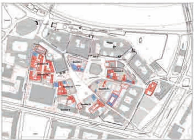
„Schauwert“: Dresden, Neumarkt, „Städtebaulich-gestalterisches Konzept“, 2000/2001, Dezernat Stadtentwicklung und Bau, mit eingetragenen „Quartieren“ und „Leitbauten“, deren Fassaden etappenweise rekonstruiert werden; eine große Anzahl Neubauten erhalten historisierende Hüllen...