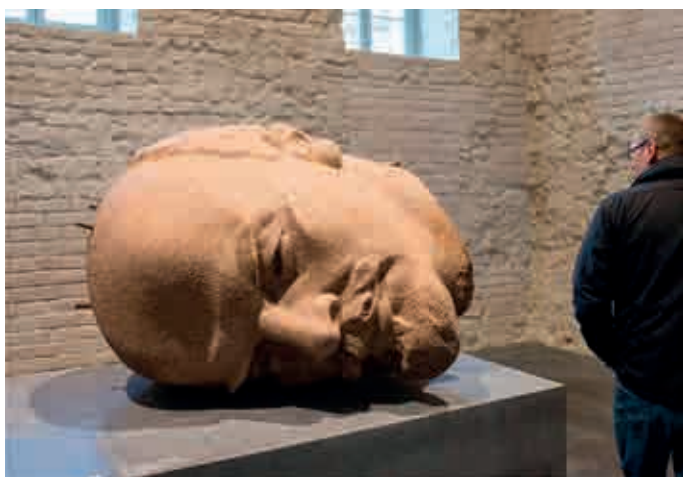
Kopf des Lenindenkmals. In der Spandauer Zitadelle Ausstellung „Enthüllt – Berlin und seine Denkmäler“ – seit 29. April 2016.