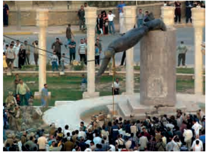
Bagdad, 9. April 2003, ein Standbild von Saddam Hussein am Firdaw-Platz wird gestürzt