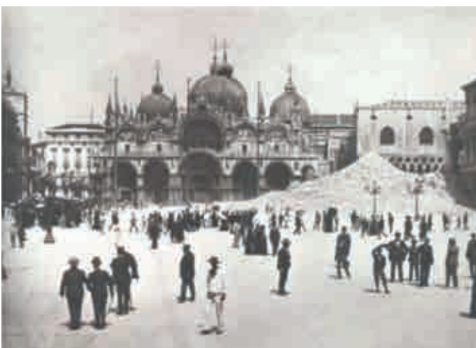
Venedig, Piazza San Marco mit Campanile, am 14. Juli 1902 eingestürzt