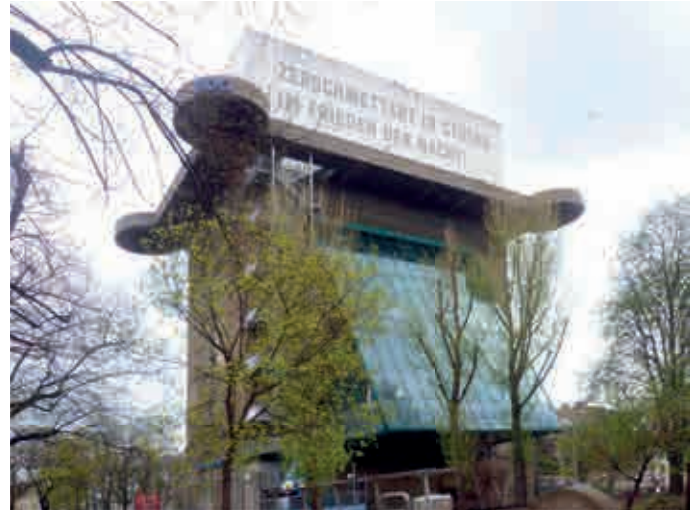
Flakturm aus dem Zweiten Weltkrieg am Eserhazypark in Wien, umgebaut und umgenutzt als Haus des Meeres (1965-1988 ff.)