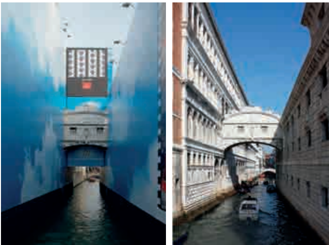
„Plurivalenzwert“ (Wilfried Lipp): Venedig, Ponte dei sospiri (Seufzerbrücke). Denkmale dienen zuweilen auch „trivialen, alltagsbezogenen und fiktionalen“ Ansprüchen