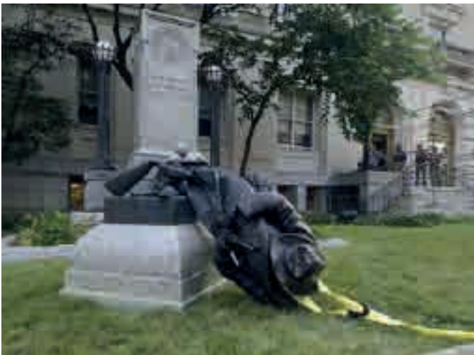
Filmstill: Sturz eines Südstaaten-Denkmal in Durham North Carolina USA, am 14. August 2017. Die Statue erinnerte an den Amerikanischen Bürgerkrieg 1861-1865. Während die Union der Nordstaaten gegen die Sklaverei war, wollte die Konföderation der Südstaaten die Sklaverei und Unterdrückung der Schwarzen beibehalten.