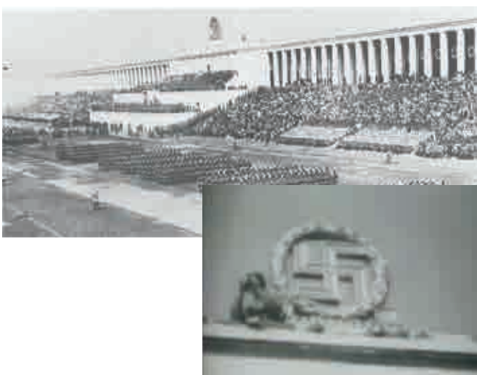
Reichsparteitagsgelände Nürnberg, Zeppelfeld mit Zeppelintribüne während eines Aufmarsches am Reichsparteitag 1937