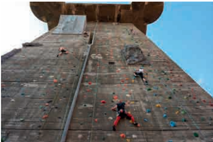
Der Flakturm am Esterhazypark in Wien dient auch als Kletterturm